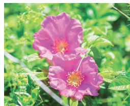
くすみ*をケアする ハマナスエキス