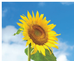
肌をうるおす ヒマワリオイル